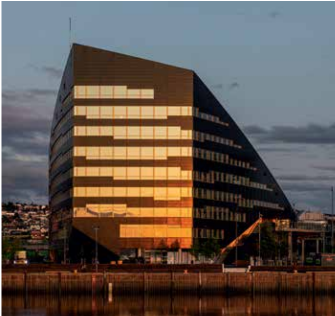
20 Ein Gebäude als Kraftwerk