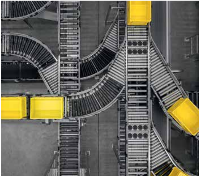
16 Unternehmenskultur 4.0: Harting European Distribution Center