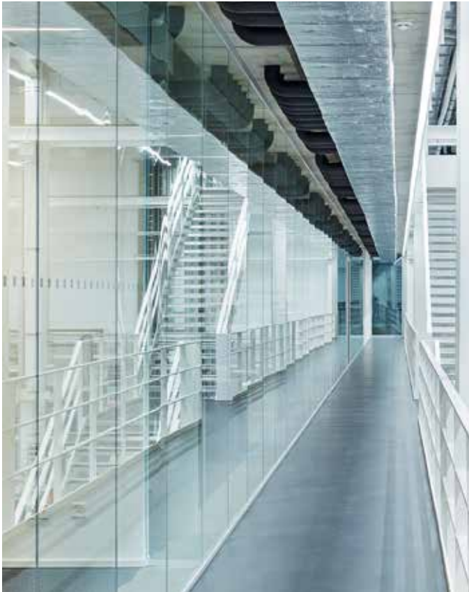
14 Produktionsbauten: Emag Montagehalle