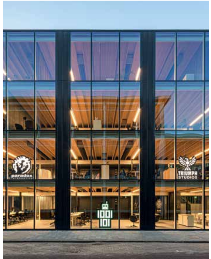
34 Bauen mit System: D(Emountable) von cepezed