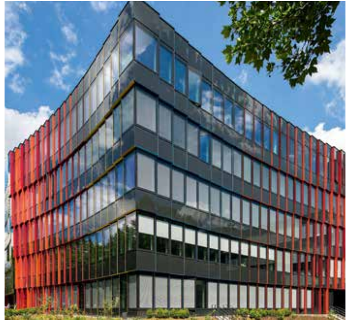
40 Umnutzung mit Vorhangfassade