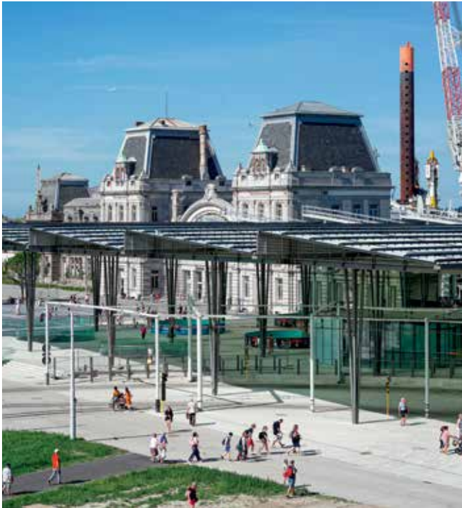
18 Bahnhof Ostende, Belgien: Mobilitätsdrehscheibe am Meer