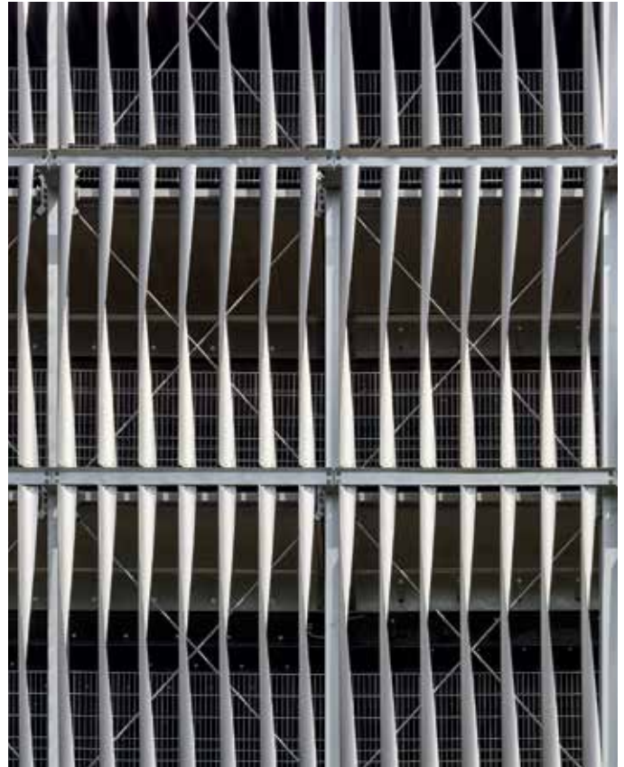
38 Fassadensysteme: Trumpf Parkhaus, Ditzingen