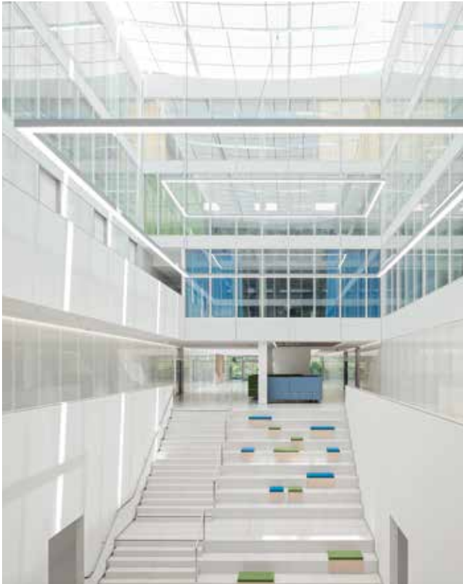
18 Krebsforschungszentrum: Haus für Wissenschaftler und Patienten