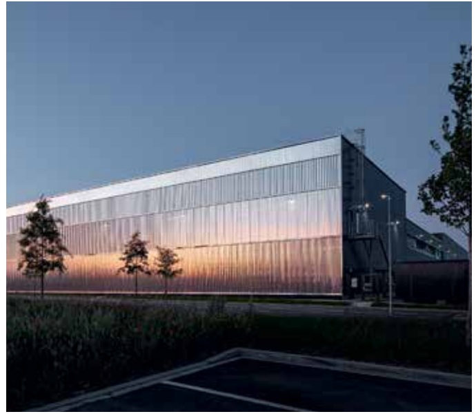
28 Matt schimmernder Monolith: Stahlverteilzentrum Aperam